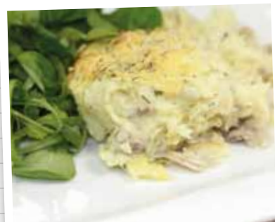
Hachis parmentier de chapon