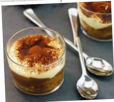
Tiramisu de bûche