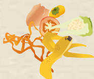
ÉPLUCHURES DE FRUITS ET DE LÉGUMES