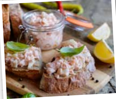
Rillettes de truite fumée