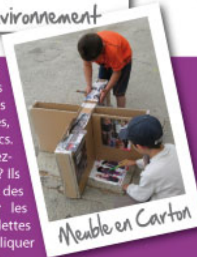
Meuble en Carton