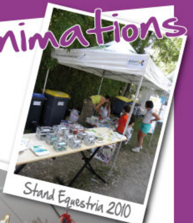
Stand Equestria 2010