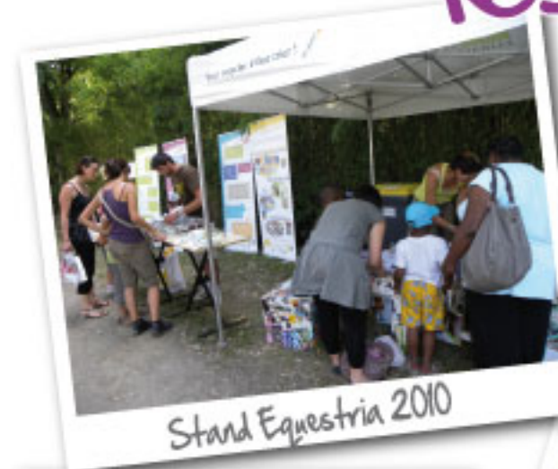
Stand Equestria 2010