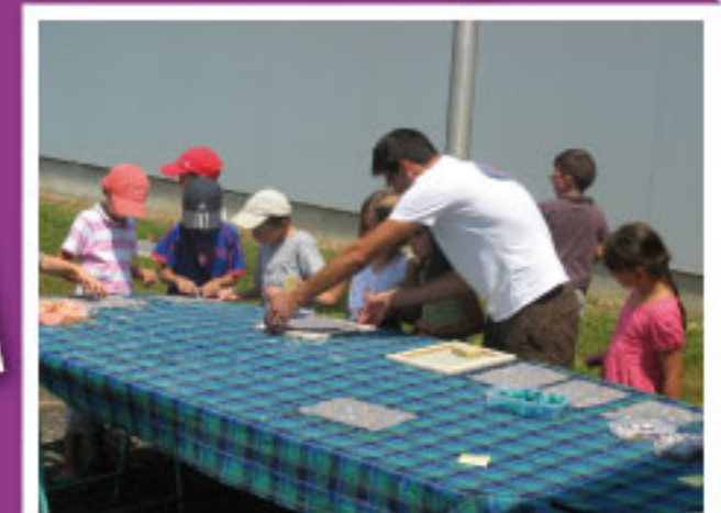
Fabrication Papier Recyclé MJC Odos

Même pendant la saison estivale les animateurs du SYMAT proposent des animations très variées, pour tout type de publics. Ainsi peut être les avez-vous croisés à Equestria? Ils y tenaient un stand avec des ateliers "origami" pour les plus petits et des maquettes pédagogiques pour expliquer le tri aux plus grands !