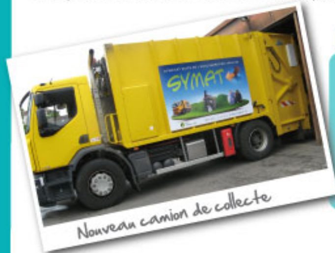
Nouveau camion de collecte

A ce jour, les élus du SYMAT ont choisi les pistes d'amélioration qu'ils souhaitent mettre en place.