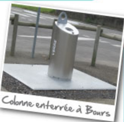
Colonne enterrée à Bours

Mise en place d'un contrôle d'accès par badge nominatif afin d'interdire la fréquentation des 4 déchèteries aux usagers ne résidant pas sur notre territoire.