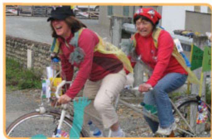
Quelques concurrents sur leur 31, recyclé bien sur !