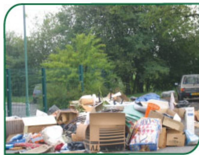
Dépôt sauvage devant la déchèterie d'Aureilhan

Merci de respecter les jours et horaires d'ouverture car le SYMAT n'hésitera pas à prendre des sanctions.