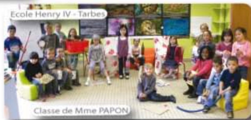
Ecole Henry IV - Tarbes