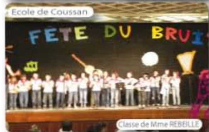
Ecole de Coussan

Pour clôturer cette fête, un goûter équitable et durable a été offert à tous les participants. Merci à tous les partenaires pour leurs contributions.