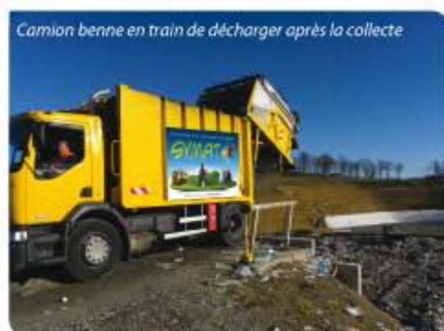
Camion benne en train de décharger après la collecte