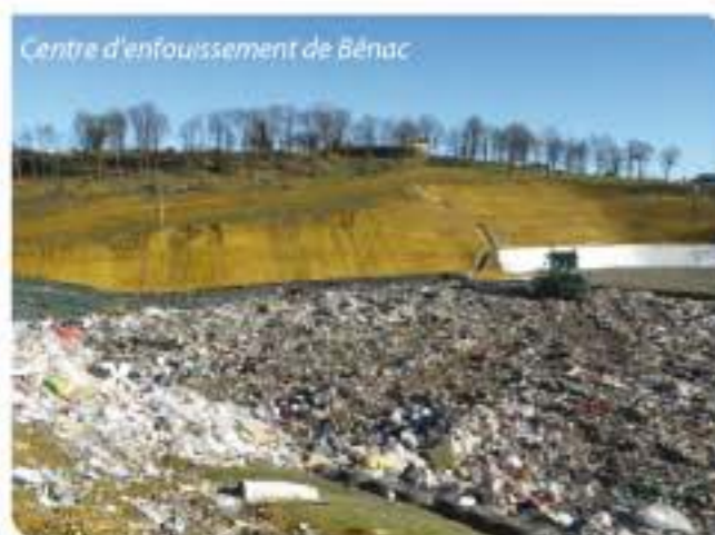
Centre d'enfouissement de Bénac