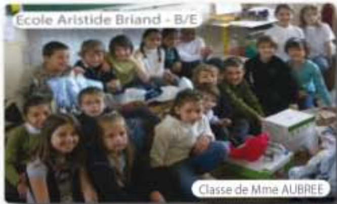
Ecole Aristide Briand - B/E