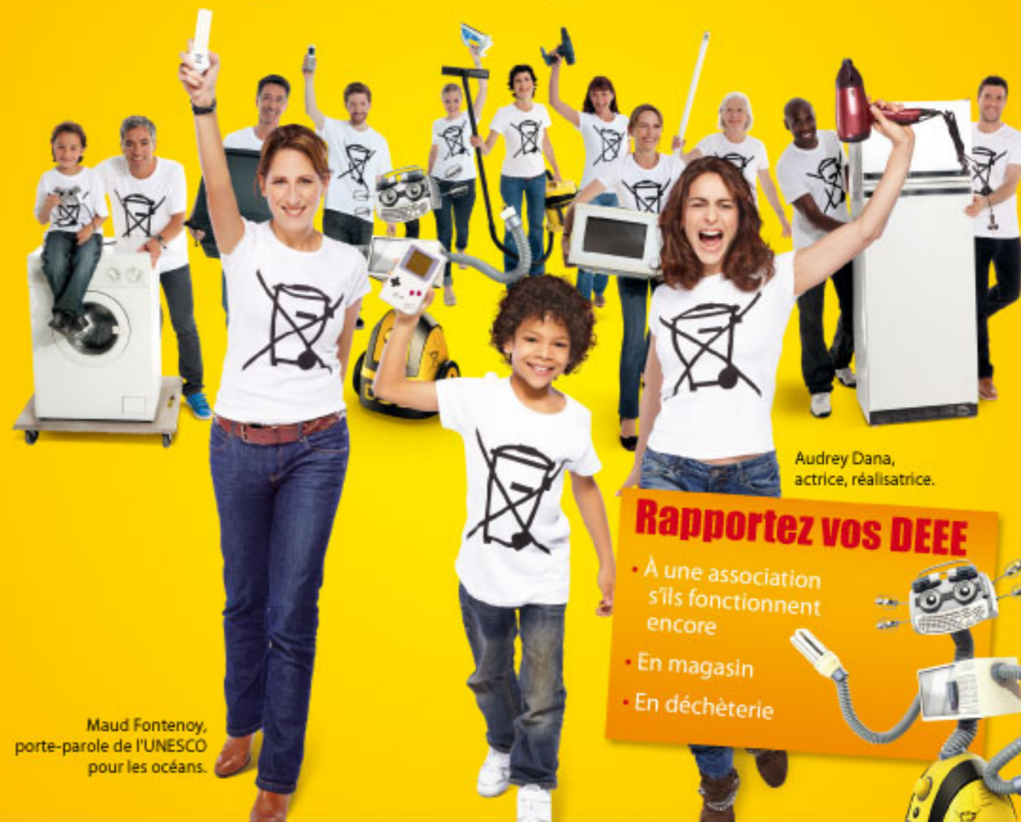
Audrey Dana, actrice, réalisatrice.