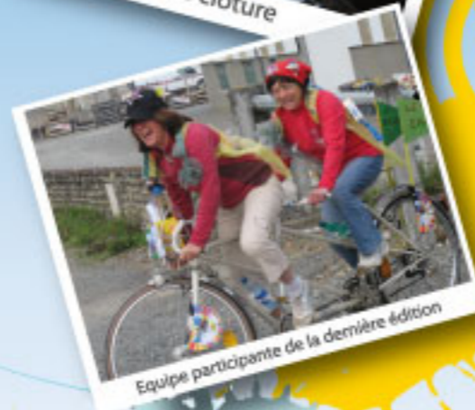
Equipe participante de la dernière édition

Inscription avant le 23 MAI www.symat.fr