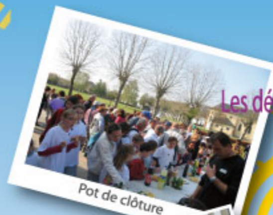
Pot de clôture

Les déguisements en déchets recyclables seront les bienvenus !