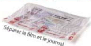
Séparer le film et le journal