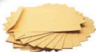
+ enveloppes à fenêtres