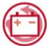
Piles et Batteries