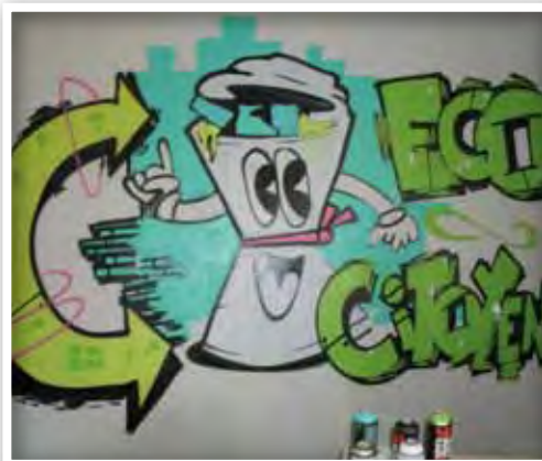
▲ Les collégiens ont créé un graff sur le thème de l'écocitoyenneté et du gaspillage.

Grâce à ces initiatives que l'on peut saluer, les élèves du collège Victor Hugo sont de véritables acteurs écocitoyens impliqués pour le monde de demain.