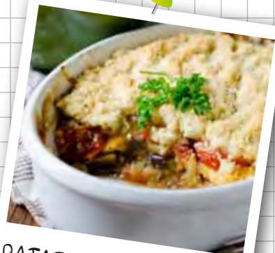
RATATOUILLE EN CRUMBLE

Recette idéale pour utiliser des restes de ratatouille et de pain