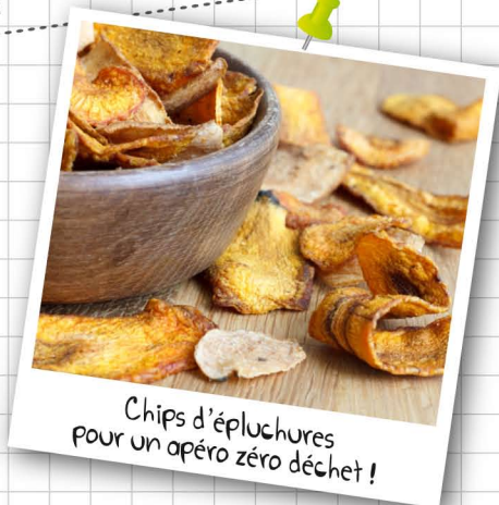
Chips d'épluchures pour un apéro zéro déchet !

Recette idéale pour utiliser vos épluchures de légumes.